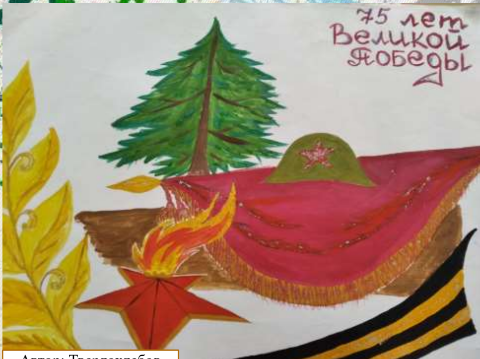
Автор: Твердохлебов Тимур, 1 класс