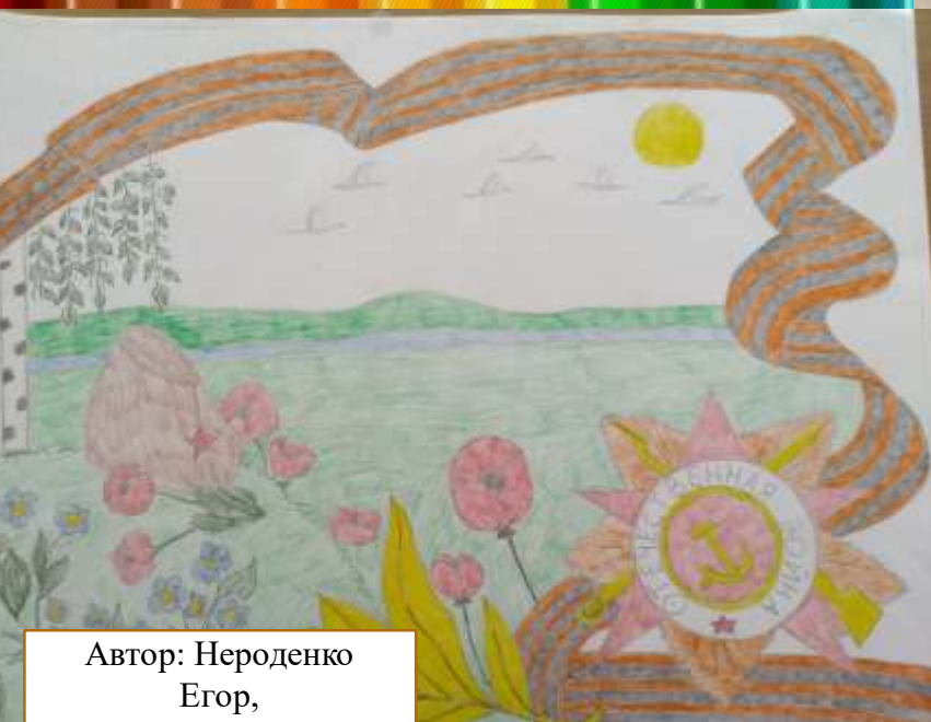
Автор: Нероденко Егор, 1 класс