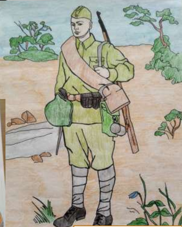
Автор: Жидков Дмитрий, 2 класс